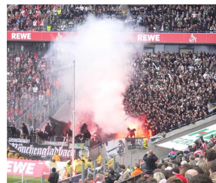
Bengalfackeln können bis zu 2.500 Grad Celcius heiß werden.