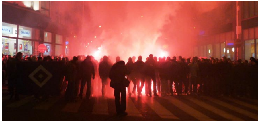
Corteo der HSV-Fans beim Europapokalspiel gegen Slavia Prag

Die Anhänger des Hamburger SV setzten Pyrotechnik in der jüngeren Vergangenheit vor allem bei Europapokalspielen ein. Stadionwelt sprach mit der Fangruppe Chosen Few Hamburg (CFHH) über das Thema Pyrotechnik im Fanblock.