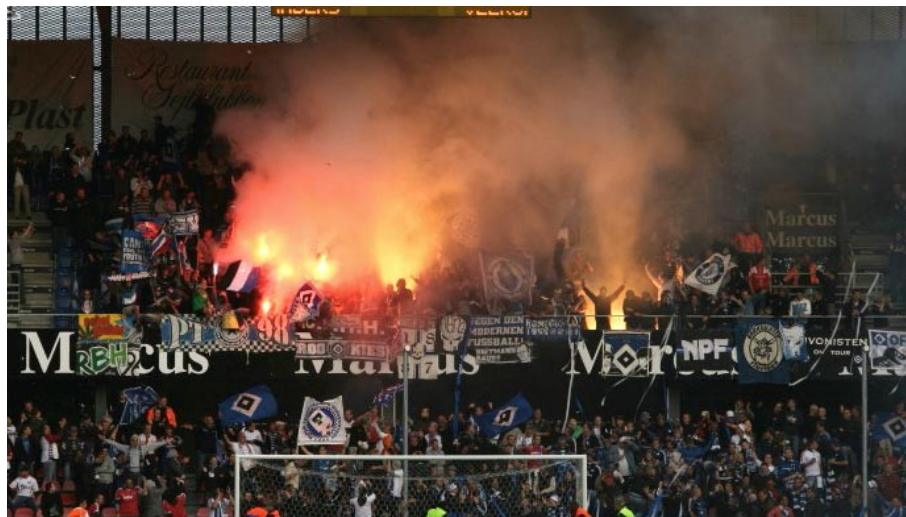
Pyroaktion der Hamburger beim dänischen Vertreter Randers FC während der Euro-League-Qualifikation 2009